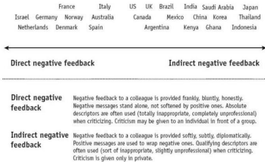
FIGURE 2.2. EVALUATING